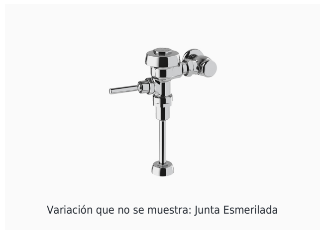
Variación que no se muestra: Junta Esmerilada